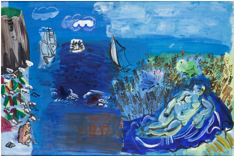
Raoul DUFY, Composition aux baigneuses et nu allongé vers 1938-1940