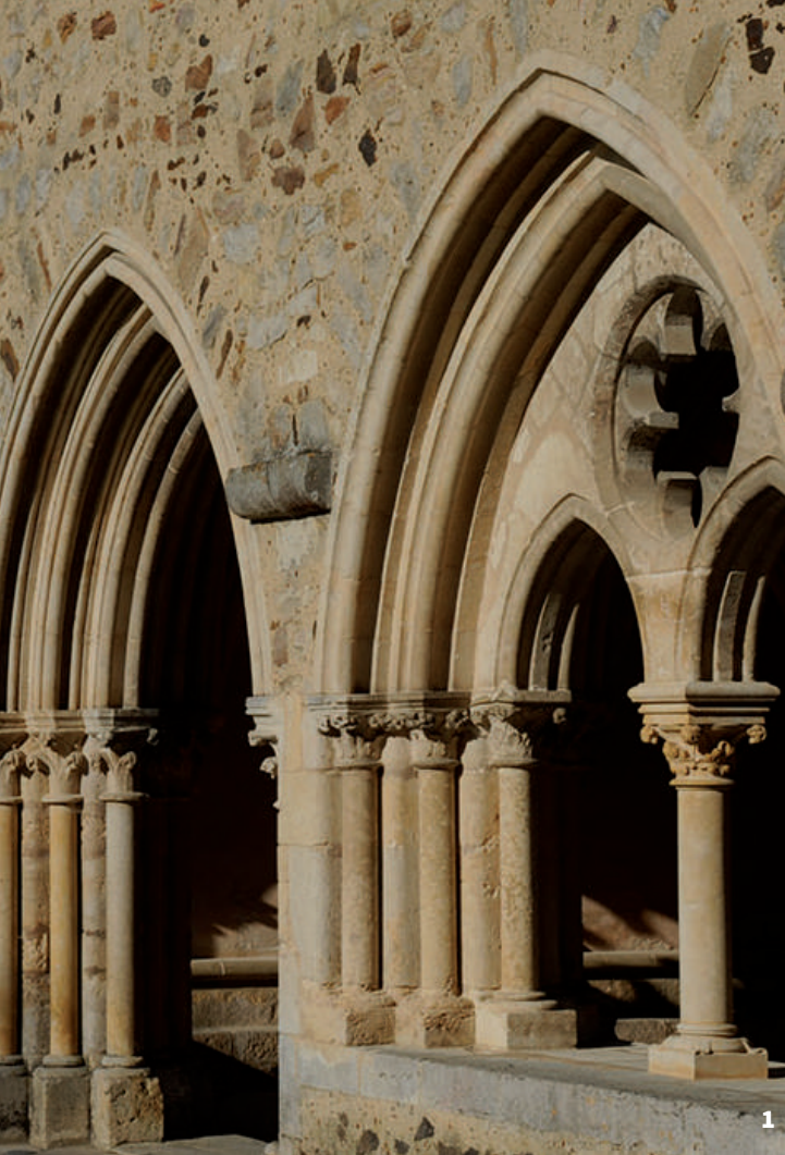
1. Abbaye royale de l'Épau 2. Anciennes piscines municipales 3. La maison des pompes