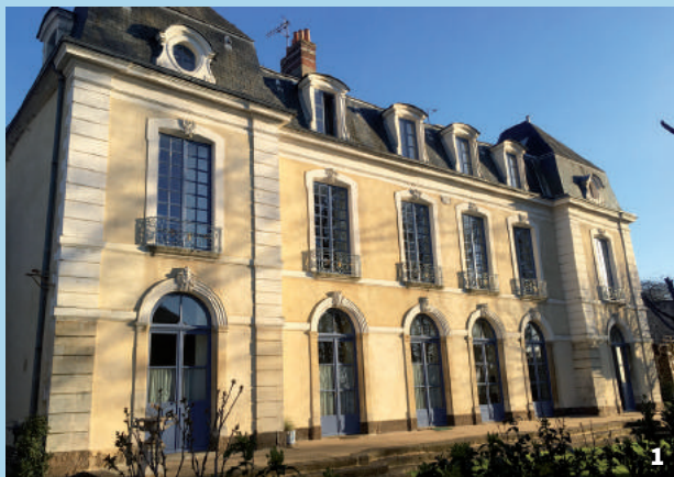
1. Hôtel Jousset des Berries 2. La Distillerie du Sonneur 3. Médiathèque du Mans