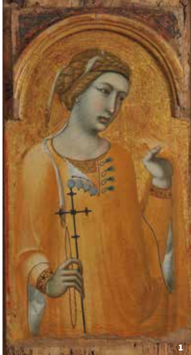
Sainte-Agathe, Pietro Lorenzetti (Musées du Mans).