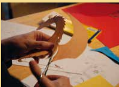
Les enfants à l'œuvre.