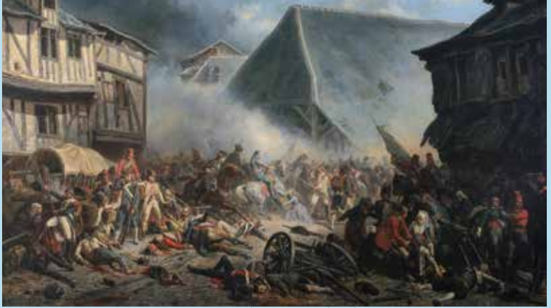
La bataille du Mans (1793) par Jean Sorieul. (Musée de la reine-Bérenère)