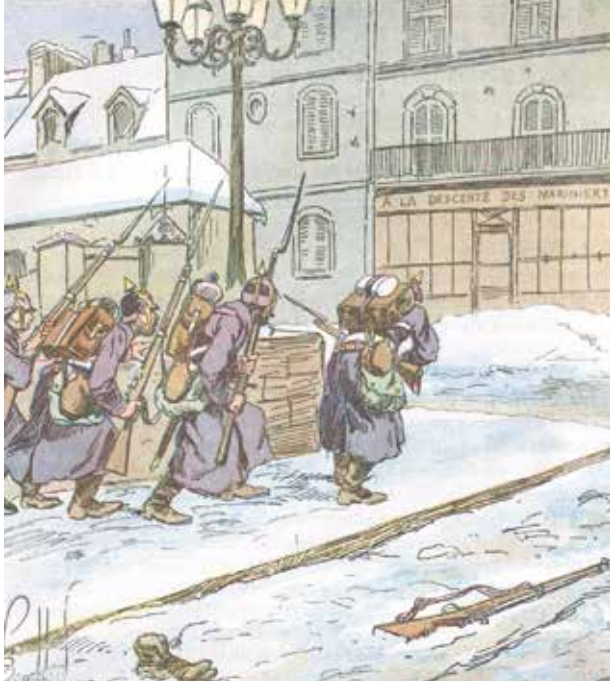
Ernest Grenet, l'Armée de la Loire - Illustrations de Louis Bombled - Paris, 1893