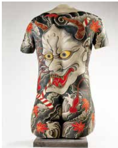
Volume tatoué sur un dos masculin figurant un masque - Filip Leu © Musée du quai Branly - Jacques-Chirac, photo Claude Germain

Dans les sociétés dites « primitives », issues des mondes orientaux, africains et océaniques, le tatouage a un rôle social, religieux et mystique. À l'inverse, en Occident, il fut marque d'infamie, de criminalité, attraction de cirque, puis marque identitaire de tribus urbaines. Durant la première moitié du XX e siècle, le tatouage a évolué au sein de cercles marginaux, et il est demeuré geste clandestin jusqu'à ce que les médias le