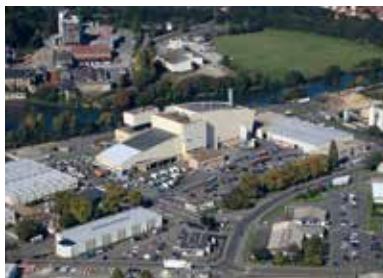
Incinérateur pour les ordures ménagères.