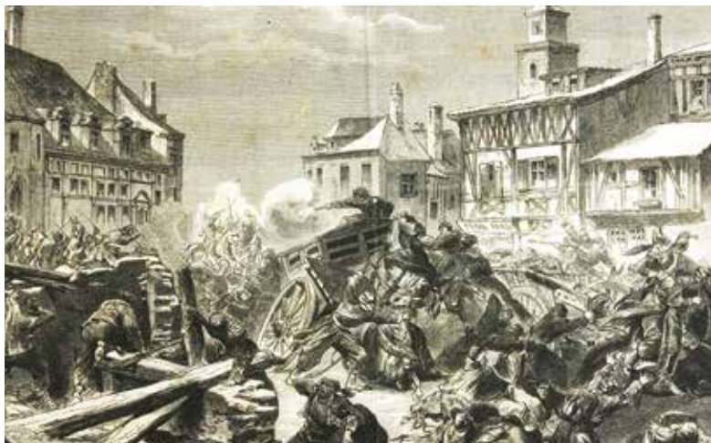
La bataille du Mans.