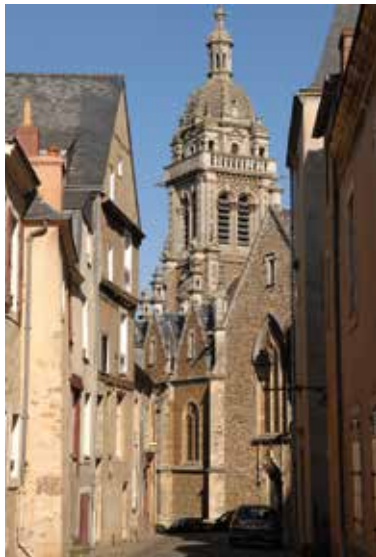
Vue sur l'église Saint-Benoît.