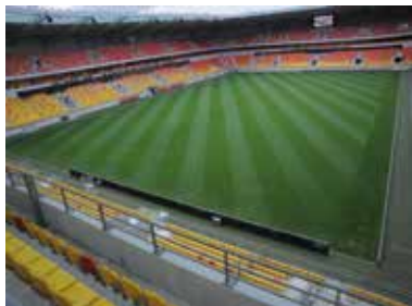
Le stade MMArena.