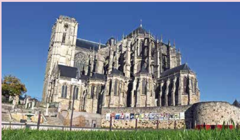
La cathédrale du Mans.