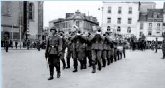
Le Mans sous l'Occupation, parade militaire, place de la République