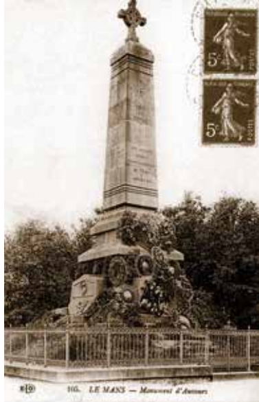
Monument d'Auvours érigé en 1874.