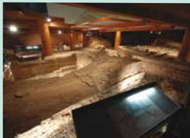
Les thermes romains.