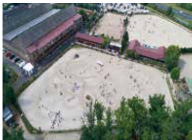
Pôle européen du cheval.