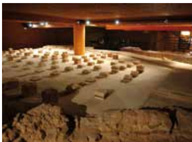
Les thermes .

Partez à la découverte de deux sites, l'espace eau du musée et les thermes, haut lieu de la vie quotidienne et de l'art de vivre romains.