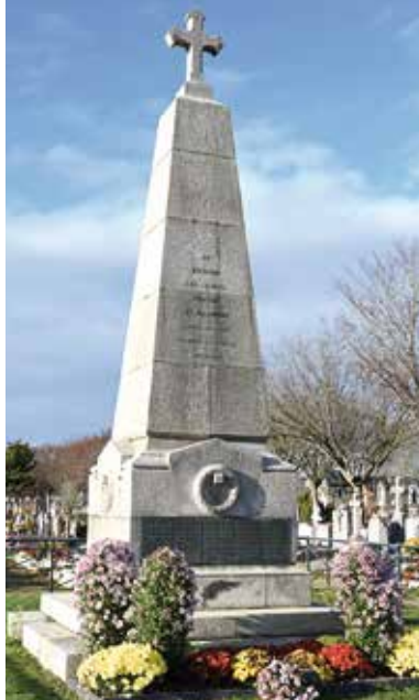
Ossuaire du cimetière de l'Ouest.