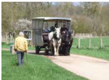
Hippomobile de la Maison de la Prairie.