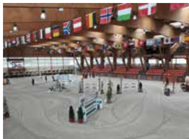
Pôle européen du cheval.