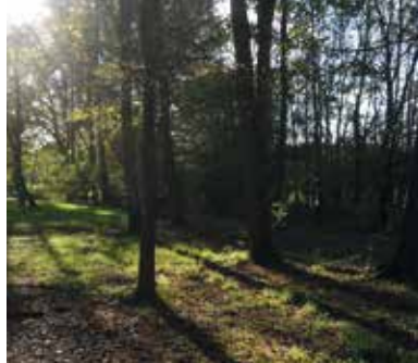
Arche de la nature.