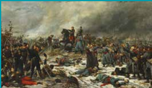
La bataille du Mans, par Lionel Royer. Musée de la reine Bérengère

2021, la Ville du Mans, ville d'art et d'histoire, propose de se souvenir de la guerre franco-prussienne de 1870-1871 et plus particulièrement de la « Bataille du Mans » qui fit rage au Mans et aux alentours, entre le 9 et le 12 janvier 1871.