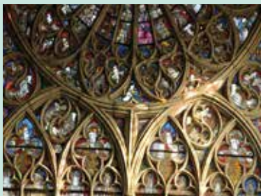
Vitraux de la cathédrale du Mans.