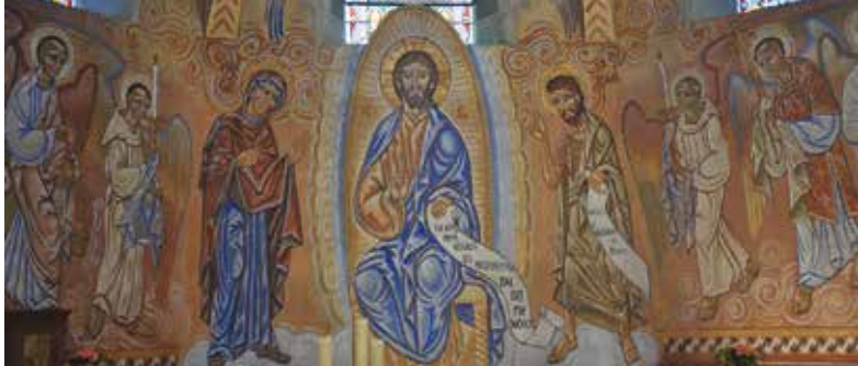
Les fresques de Nicolai Greschny.