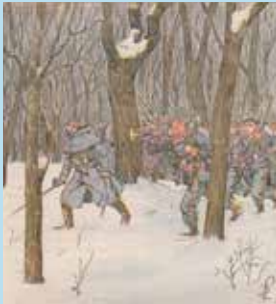
Ernest Grenest, l'Armée de la Loire - Illustrations de Louis Bombled - Paris, 1893