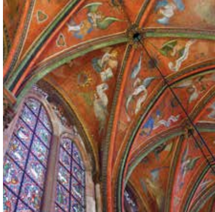
Chapelle des anges musiciens à la cathédrale.