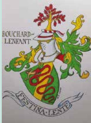
Blason - création Phillippe Roger, Avril 2020.