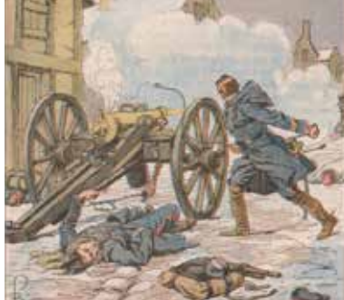
Ernest Grenest, l'Armée de la Loire - Illustrations de Louis Bombled - Paris, 1893