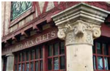
Le pilier aux clefs.