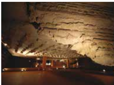
Les thermes romains.