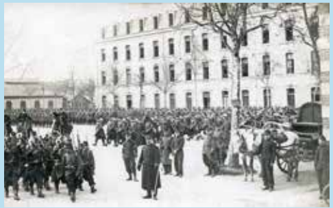
Soldats dans la cour de la caserne Chanzy, Le Mans, août 1914