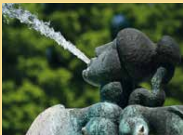
La maison de l'eau.