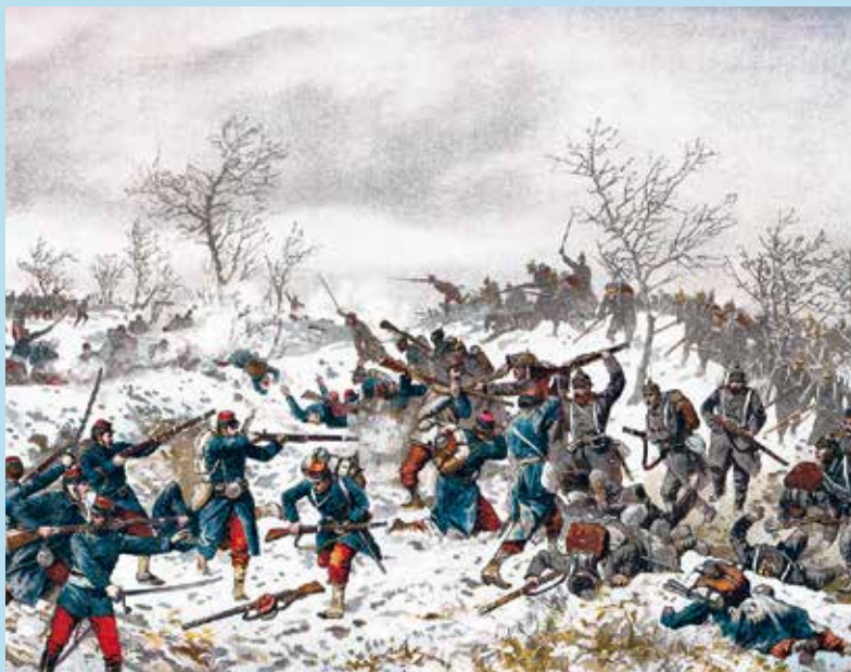
Représentation allemande de la charge d'Aouvours.