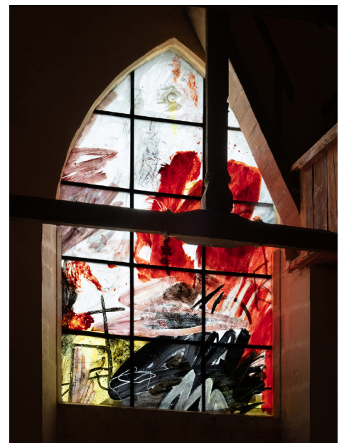
Vitrail de l'église de Crannes-en-Champagne Réalisé par Thibault de Reimpré/Éric Boucher 2010

À travers le prisme du verre, l'exposition raconte en pointillé une histoire du Mans et de son territoire. Les différents maître-verriers, artistes et personnalités qui ont marqué le décor vitré des églises comme de l'architecture civile des deux derniers siècles en Sarthe sont évoqués grâce à une sélection de projets représentatifs. L'exposition livre aussi les secrets de fabrication du vitrail, des recettes de la peinture sur verre utilisées par les différents ateliers manceaux au 19 e siècle jusqu'aux étonnantes techniques actuelles comme le fusing ou le thermoformage .